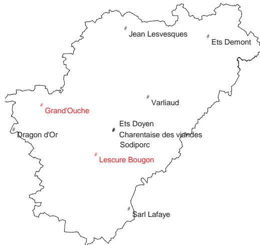
Industrie des viandes Industrie laitière