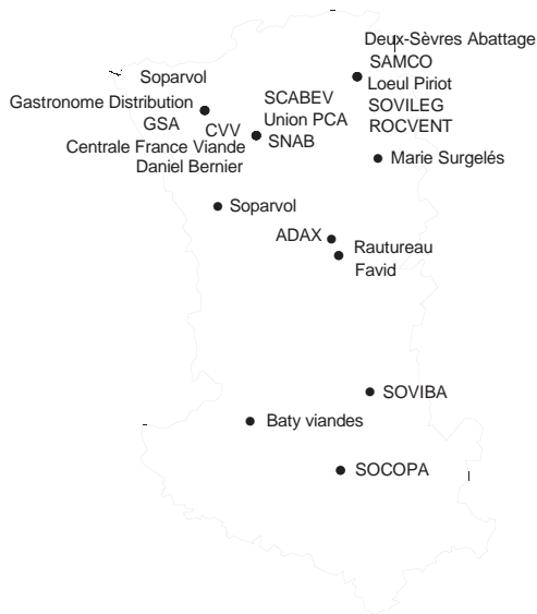
Industrie des viandes